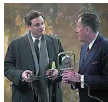
Sin piedras en la boca

de ellos, miembros del Grupo de Apoyo para Tartamudos de Asturias (Gatastur, el primero que se creó en España), ha terminado aceptando su identidad de tartamudo y trata de influir en la sociedad para romper el doloroso estigma que pesa sobre ellos. Por eso elogian una película como «El discurso del rey», la gran triunfadora de los «Oscar», porque retrata con dignidad la lucha a la que se enfrentan diariamente.